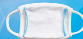
ティッシュdeマスク & 冷潤マスク