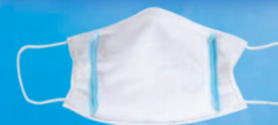
市販の使い捨てマスク